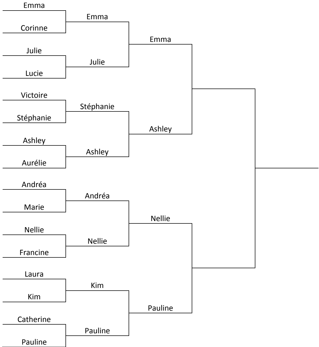
Tableau de repêchage n°1

Consigne : Effectuer le repêchage puis compléter le tableau à l'aide du classement (10,5 points)